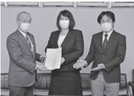
市長に要望書を渡す正副議長