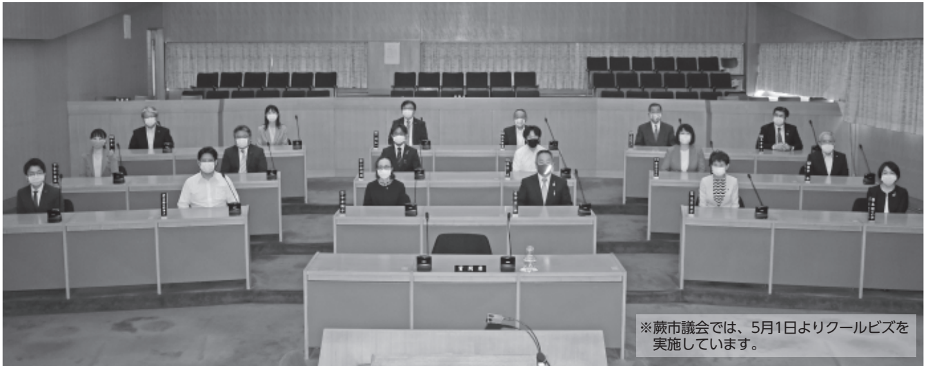
※蕨市議会では、5月1日よりクールビズを実施しています。