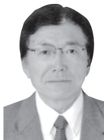
いちのせき かずいち

末までの期間で工事請負契約を締結し、11月中の約1か月間は一部を除いて施設を休館する予定である。